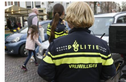
Politie brandweer redding