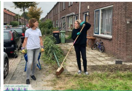
In de buurt