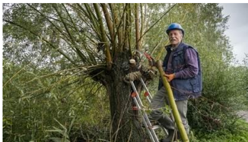
Tuin- natuur- bos onderhoud