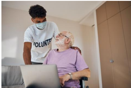
In de formele zorg